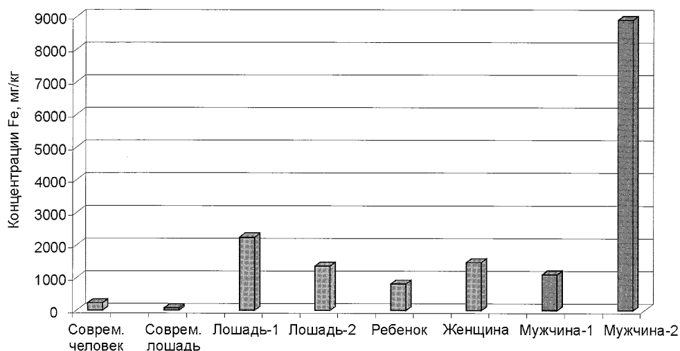
Рис. 1. Содержание Fe в волосах.